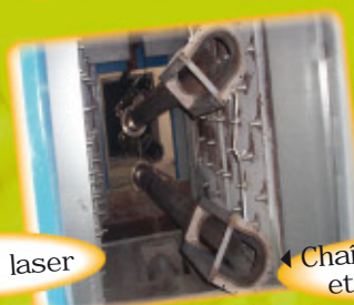
▲ Châssis décapage et peinture