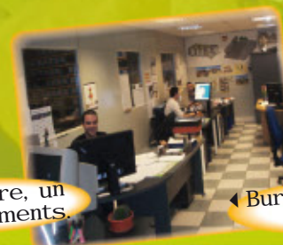
▲ Bureau d'Etudes, Electricité