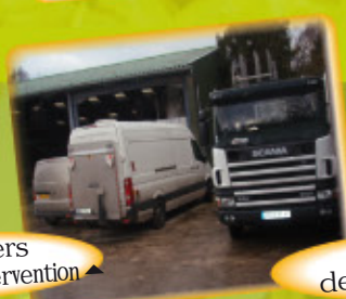
▲ Véhicule de livraison