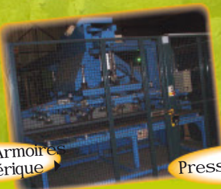
▲ Presse plieuse