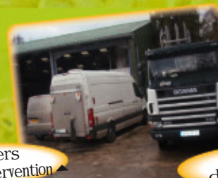
véhicule de livraison