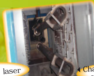
Chaînes décapage et peinture