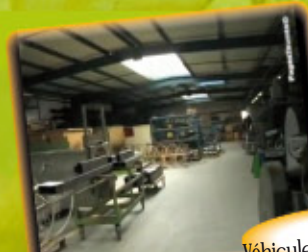
Ateliers Véhicules d'intervention