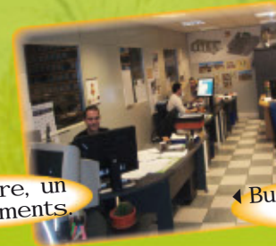
Bureau d'Etudes, Electricité